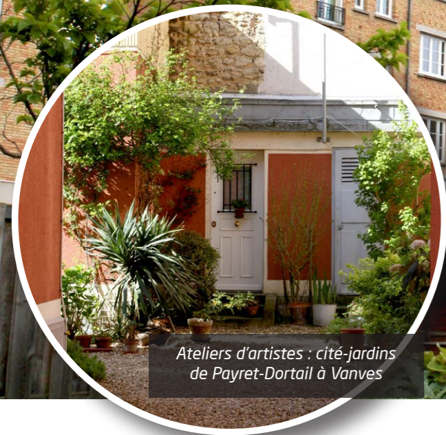
Ateliers d'artistes : cité-jardins de Payret-Dortail à Vanves