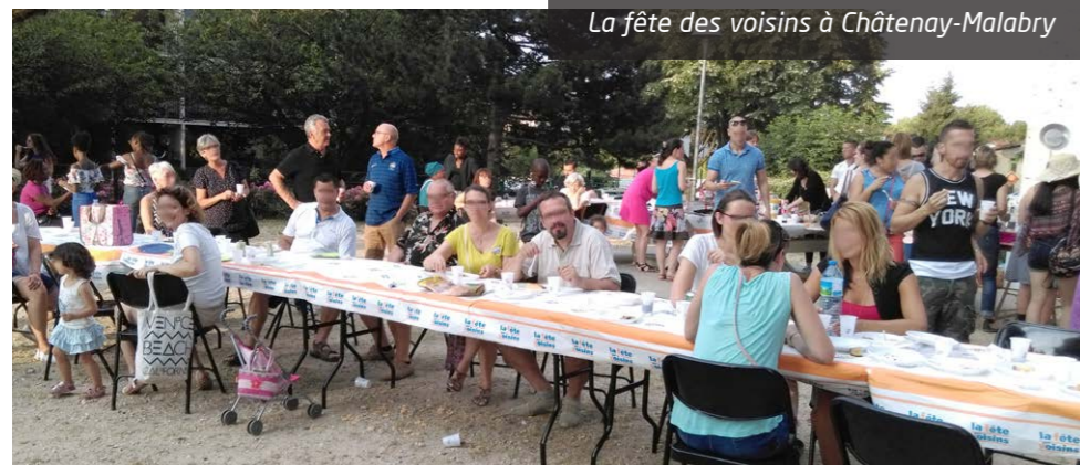
La fête des voisins à Châtenay-Malabry

Le mois de mai dernier a été marqué par une météo capricieuse. Cela n'a pourtant pas empêché de nombreux locataires de respecter la tradition en se donnant rendez-vous pour la fête des voisins, avec l'appui de leurs gardiens et de leurs représentants.