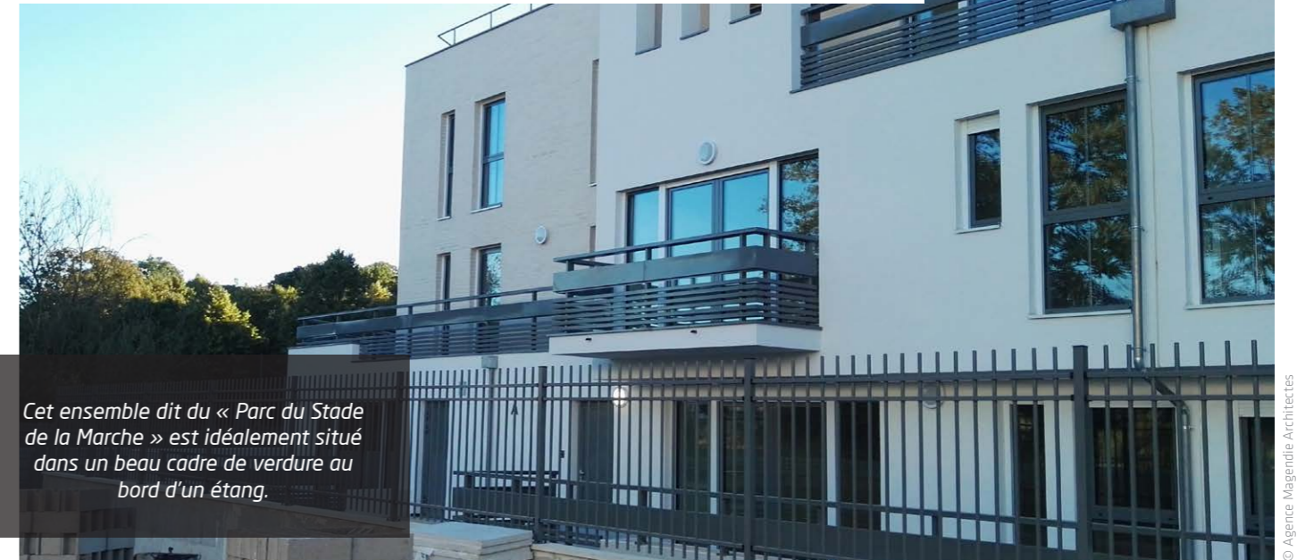
Cet ensemble dit du « Parc du Stade de la Marche » est idéalement situé dans un beau cadre de verdure au bord d'un étang.