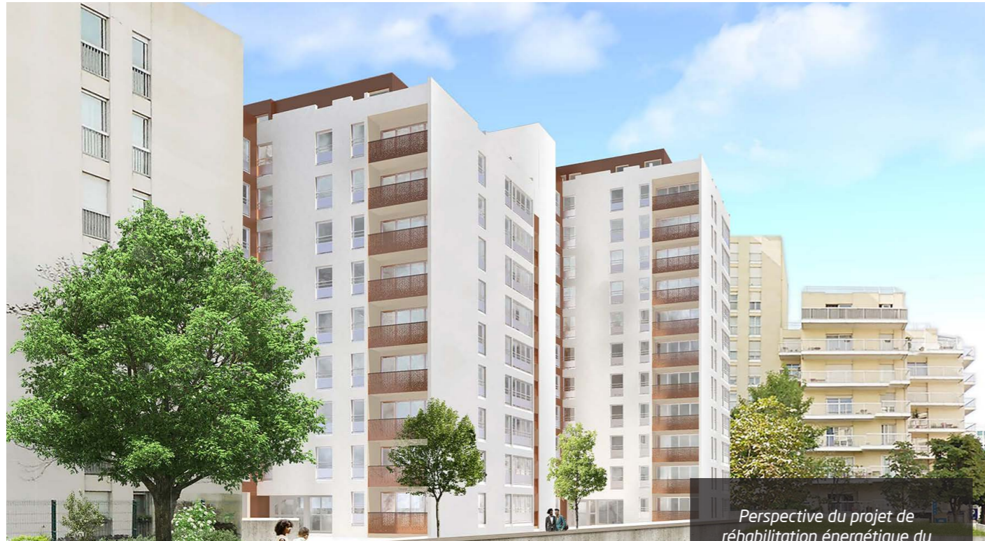
Perspective du projet de réhabilitation énergétique du 12/14 place de la gare