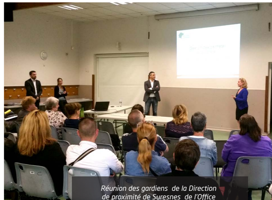
Réunion des gardiens de la Direction de proximité de Suresnes de l'Office

Faire monter en compétences la fonction gardien [...] tout en facilitant la réactivité dans les réponses à apporter aux locataires. "