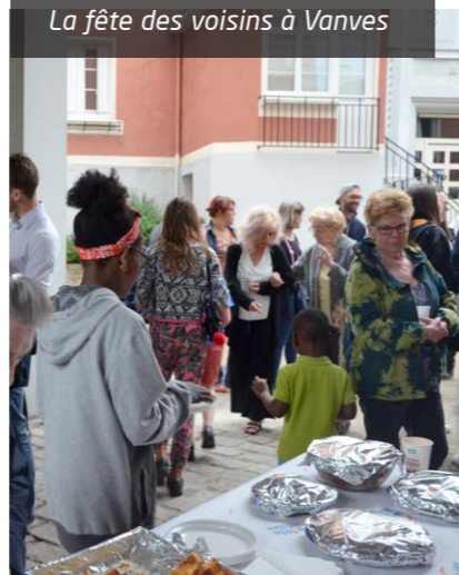
La fête des voisins à Vanves

En association avec Immeubles en Fête, l'Office a soutenu les organisateurs en leur proposant des kits Fête des voisins, composés de nappes, gobelets, t-shirts... La prochaine édition se tiendra le 31 mai 2019. ■