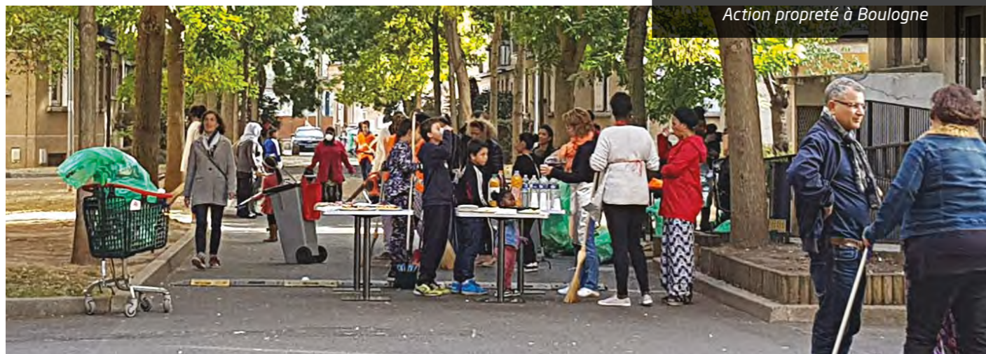
Action propreté à Boulogne

Ateliers de tri, ateliers d'économies d'énergie, opérations de ramassage des déchets... Les directions de proximité de Hauts-de-Seine Habitat se mobilisent pour l'environnement et la propreté des résidences.