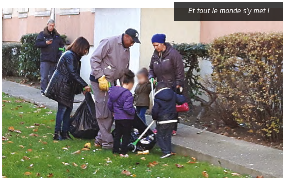
Et tout le monde s'y met !

Sensibiliser, accompagner et participer sont les maîtres mots de ces initiatives locales, destinées aux jeunes et aux moins jeunes. ■