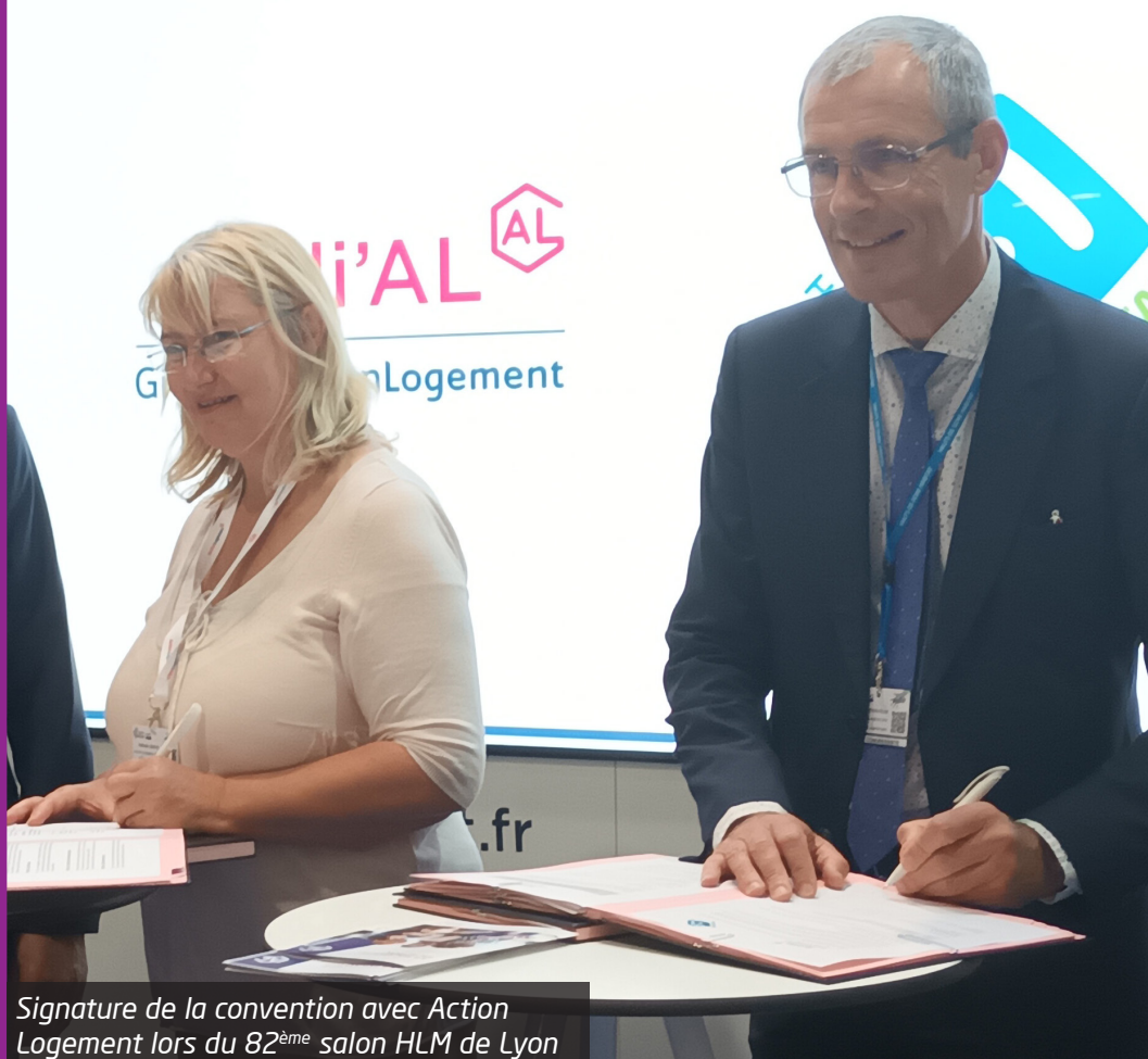
Signature de la convention avec Action Logement lors du 82ème salon HLM de Lyon

5,5% C'est le taux de TVA sur le chauffage demandé par l'Office (au lieu des 20 % actuellement)