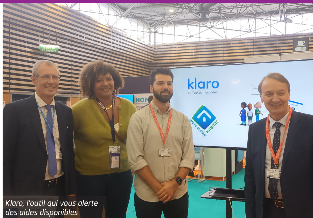
Klaro, l'outil qui vous alerte des aides disponibles

Saviez-vous que près d'une aide sur trois n'est jamais réclamée et que chaque foyer pourrait en moyenne recevoir 110 € supplémentaire