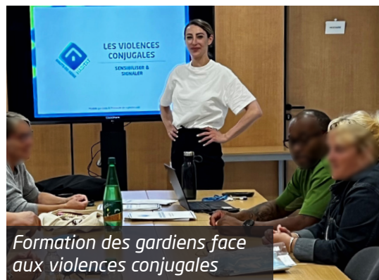
Formation des gardiens face aux violences conjugales

3919 C'est le numéro d'appel national Solidarité Femmes. Anonyme et gratuit.