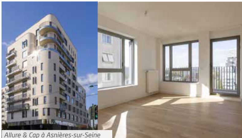
Allure & Cap à Asnières-sur-Seine

*Prix TTC (TVA réduite à 5,5%) - Parking inclus dans le prix