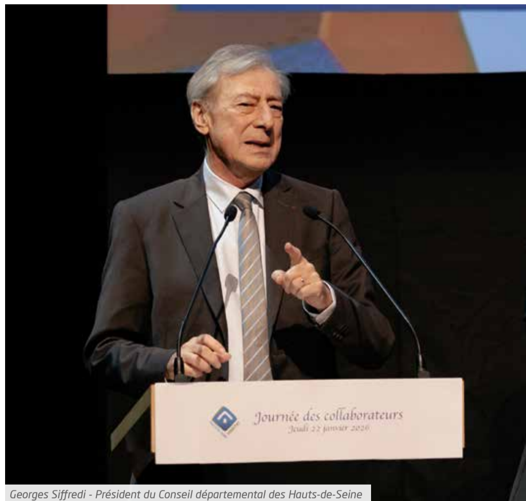
Georges Siffredi - Président du Conseil départemental des Hauts-de-Seine

Comme l'a cité Yann Chevalier en reprenant Grand Corps Malade : « C'est aujourd'hui que ça se passe ». Pour les 44 000 foyers déjà logés par l'Office, et pour les milliers d'autres en attente, 2026 sera l'année où chaque action, chaque investissement, chaque parole devra converger vers une seule finalité : un logement social qui répond pleinement aux attentes de ceux qu'il sert.