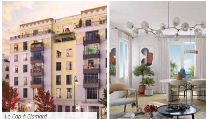
Le Cap à Clamart

Ne laissez pas passer cette opportunité. Contactez-nous !